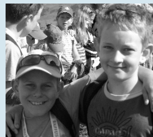
Die Schatzsuche war erfolgreich.

Was während einem Jahr intensiver Vorbereitung zum Thema «Schatzsuche» den Kindern angeboten wurde, lässt sich schlecht in Worte fassen, da muss man dabei gewesen sein.