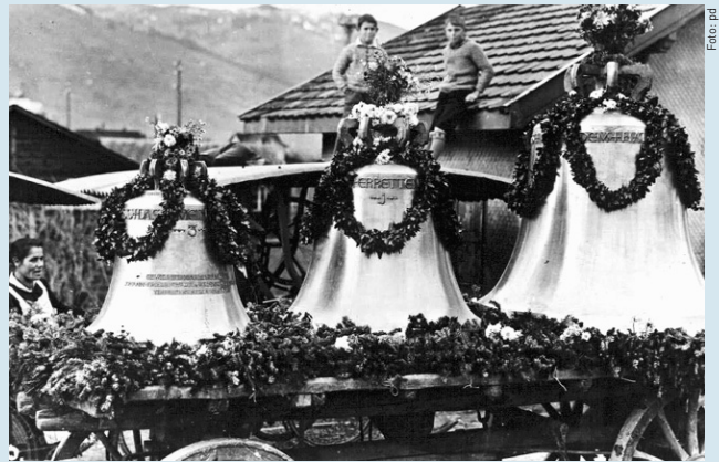
Reich geschmückt treffen die Glocken vor der Buchser Kirche ein.