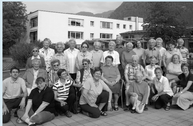
Die Gruppe der Ferienwoche 55plus in Interlaken.