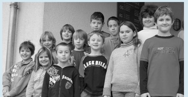
Schulklassen 2007 Kappeli und Grof.