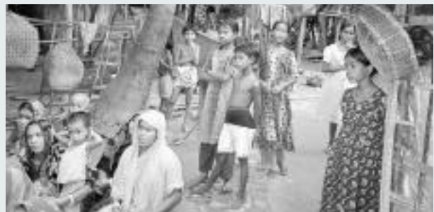
Informationen über Gesundheit sind für Kinder und Schwangere wichtig.

Erstmals startet der Lauf um 13 Uhr. Von 11 bis 17 Uhr findet das Rahmenprogramm statt. 3.-Welt-Organisationen sind mit attraktiven Angeboten dabei. Es gibt für alle etwas: Kinderhütendienst, Sinnvolles Shopping, eine Festwirtschaft mit feinem Mittagessen, Musik und Spannung beim Lauf. Alle können am 17. Grabser 2-Stunden-Lauf mittun, als Zaungäste, Höckler oder aktiv Mitlaufende!