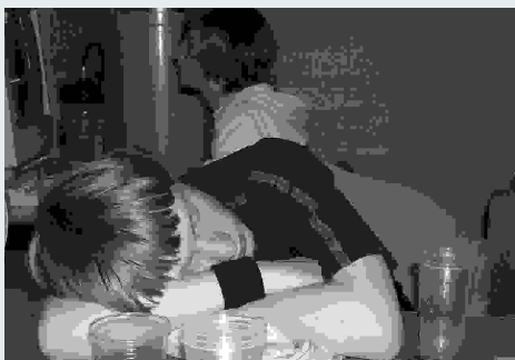
Gamen erfordert auch seine «Opfer».