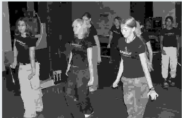
Die Hip-Hop Tanzgruppe «roundabout» wirkte im Gottesdienst mit.