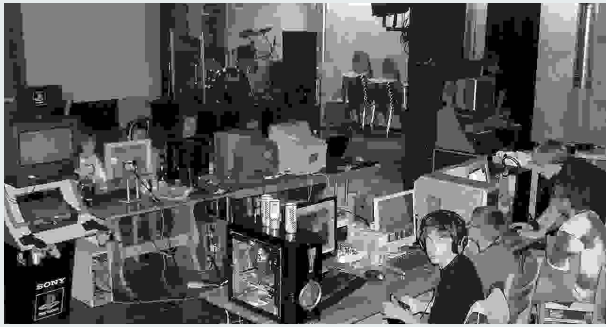
Aufbau mit den eigenen Computern.