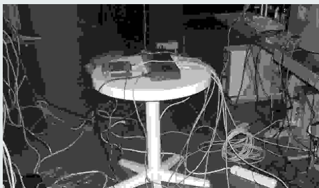
Geduld war beim Aufbau gefragt ...