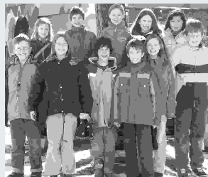
3. Klasse 2006 Grof und Flös.