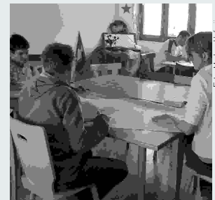
Konzentriert setzt man sich mit dem Thema auseinander.

Verantwortlich für die Gemeinde- seite und Adressänderungen an: Sekretariat, Churerstrasse 3, Telefon 081 756 22 93 Dienstag, Mittwoch und Freitag von 8 bis 11.30 Uhr