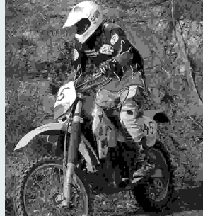
Auch Trial-Fahren gehört zu diesem coolen Wochenende.